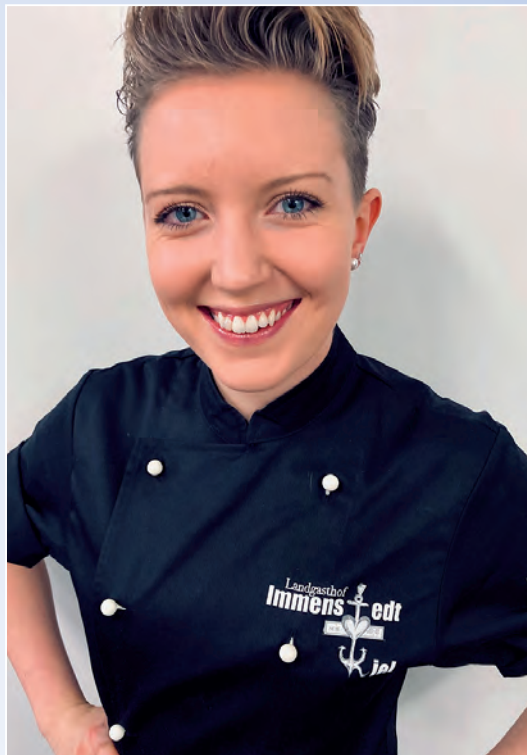
„Wir holen eine ordentliche Portion Kultur aufs Land!“