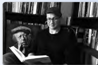
„Paul Dahlke - Die Biographie“ „Und finden wir uns dereinst wieder“ (Film) Donnerstag, 20. Mai 2021