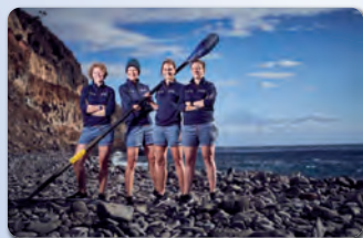
„Wellenbrecherinnen - Das Abenteuer der deutschen Atlantikerinnen“ Mittwoch, 12. Mai 2021