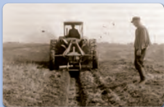
„Bei uns in Schleswig-Holstein“ Mittwoch, 21. April 2021 Freitag, 23. April 2021