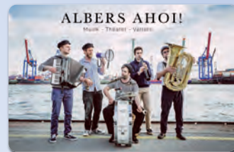
„ALBERS AHOI! Junge Männer, altes Liedgut“ Samstag, 18. September 2021