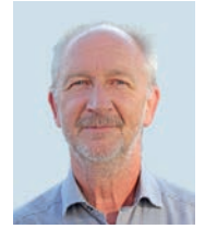
Olde Oldsen Langenhorn