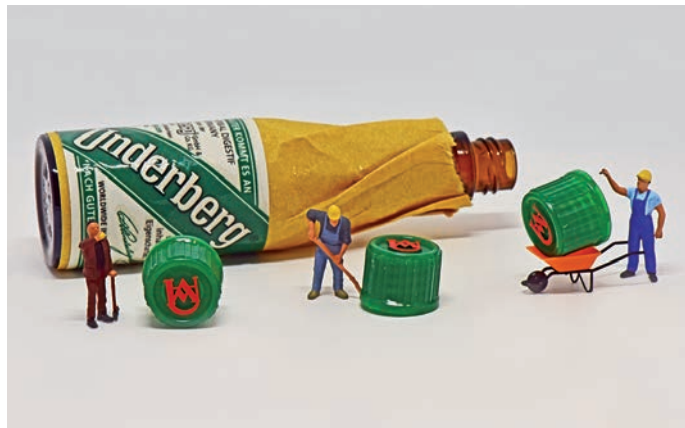
In ihrem Fotostudio erstellt Susanne Weber Mini-Welten wie diese. Eine Ausstellung im Amtsgebäude zeigt mehr als 20 dieser Werke.