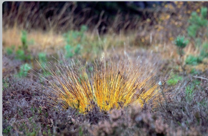
Foto-Walk durch die Bordelumer Heide