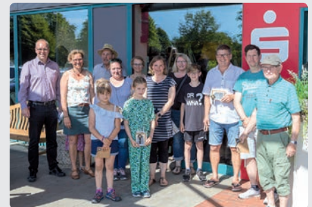
Die Gewinner/innen vom Escapespiel im Möbelhaus Jessen

Wirklich tolle Festtage – unsere Erwartungen wurden übertroffen und die Begeisterung war groß, denn so etwas gab es bei Möbel Jessen in den vergangenen 90 Jahren schließlich noch nie.