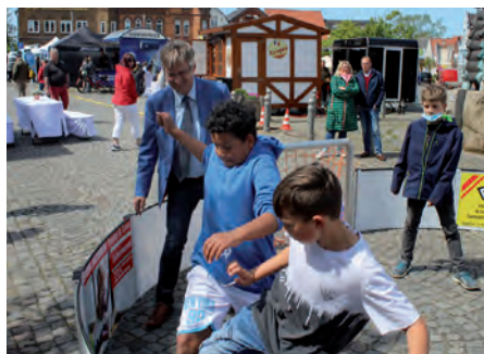
Sportlich wurde es im Soccer-Ei des HGV.