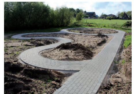
Im Außenbereich findet sich eine „Rennbahn“ für die Kleinen.