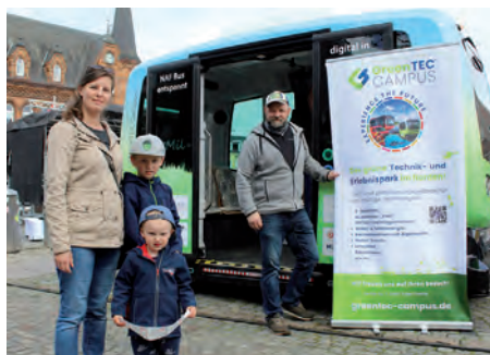
Der elektrisch und autonom fahrende Bus "Emil" zählte zu den beliebtesten Anlaufpunkten des Aktionstags.

Bis 17 Uhr nutzen Schaulustige die Gelegenheit, sich rundum zu informieren. Mit vor Ort waren beispielsweise das regionale Einkaufsportal