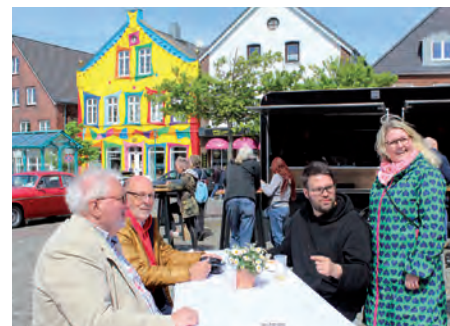
Gute Laune und strahlender Sonnenschein begleiteten den Aktionstag.

Kommunen Ideen, die Mobilität in der Region nachhaltig weiterzuentwickeln. Wie lassen sich individuelle Bedürfnisse, Nachhaltigkeit und Klimaschutz verbinden? Können wir Mobilität umweltverträglich und zugleich sozial gestalten? Welche Lösungen sind kurzfristig möglich und wie sieht es mit der Mobilität auf dem Lande in 20 Jahren aus? Fragestellungen, die innerhalb des Projekts mit innovativen Partnern wie dem GreenTec-Campus aus Enge-Sande, der Firma GP Joule aus den Reußenkögen oder auch Partnern wie NAH.SH bearbeitet wurden und werden.