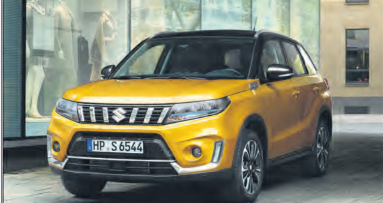
Abbildung zeigt aufpreispflichtige Sonderausstattung.