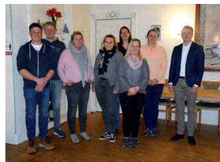
Der Vorstand des Ringreitervereins.