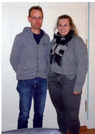
Das Bild zeigt den alten und die neue Vorsitzende/n

Ausserdem soll ein Container für die Lagerung der benötigten Gerätschaften angeschafft werden. Dafür hat der Verein „Frischer Wind“ finanzielle Hilfe zugesagt.