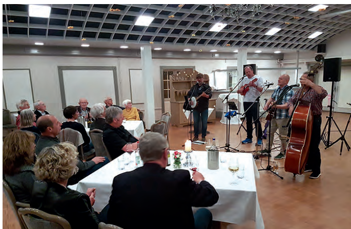
De Watermänner und een Fisch spielen vor den Gästen

rige Kinder. Insgesamt hat der Park eine Leistung von 2.128 KW Nennleistung. Seit Beginn hat der Park ca. 25 Mio. kWh produziert und jährlich konstant gute Gewerbesteuer an die Gemeinde gezahlt.