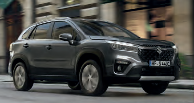
Abbildung zeigt aufpreispflichtige Sonderausstattung.