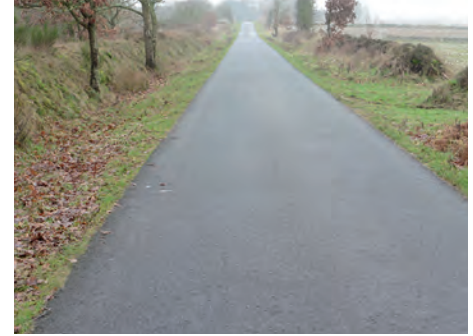
Weg nach Verstärkung

Es wurden im Rahmen der Flurbereinigung Ahrenshöft ca. 100 Flurbereinigerungsverhandlungen durchgeführt.