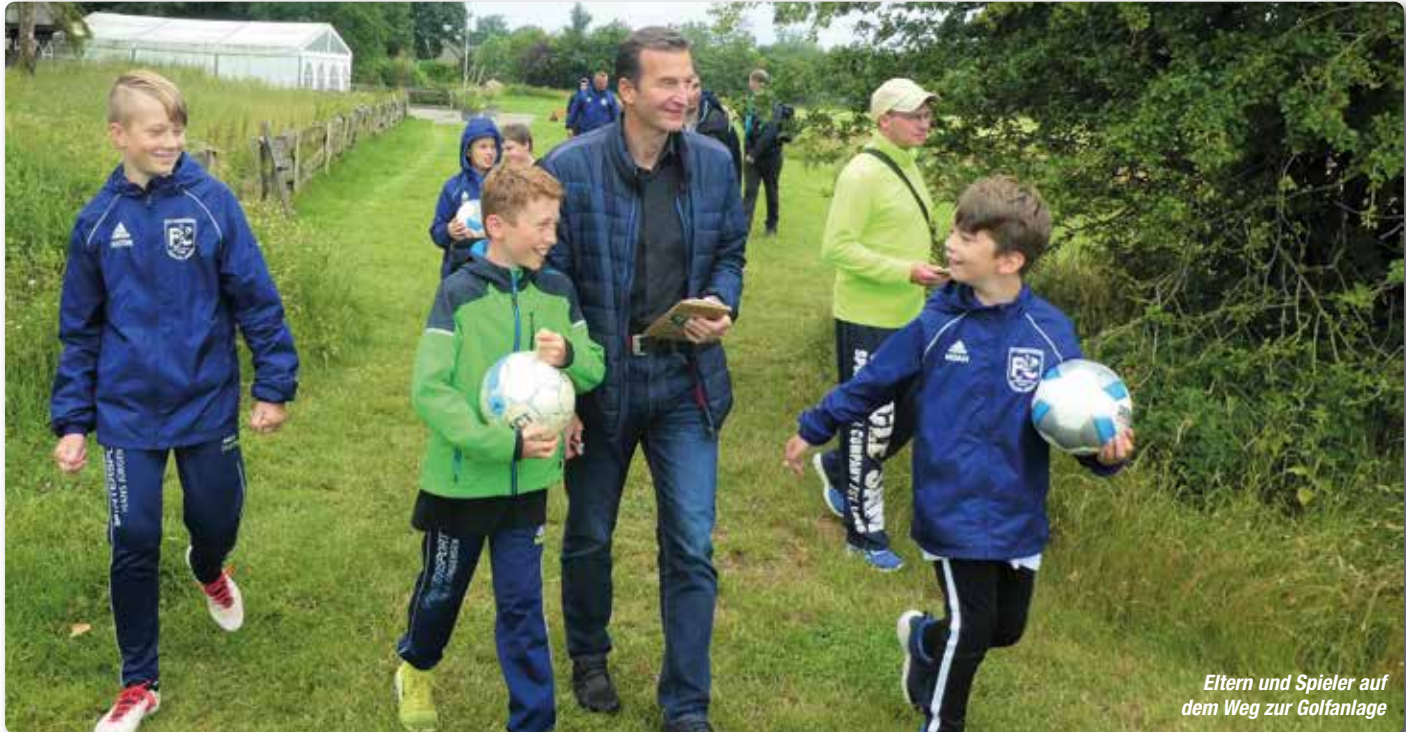
Eltern und Spieler auf dem Weg zur Golfanlage

Zum Abschluss der „unvollendeten“ Saison traf sich die E2-Jugend des FC Wiesharde mit Eltern und Trainern auf der 18-Loch-Bahn in Hüllerup. Unter Beachtung der aktuellen Hygienemaßnahmen wurden die Aktivitäten größtenteils unter freiem Himmel absolviert. Zunächst ging es in gemischten Kleingruppen mit Vätern und Müttern zum Wettkampf auf das weitläufige Areal der Fußballgolfbahn. Statt mit Caddy, Schlägern und Golfbällen wurde die Geschicklichkeit zum