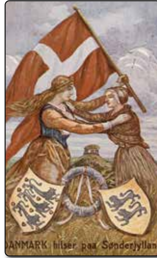
Dänische und deutsche Wahlplakate.