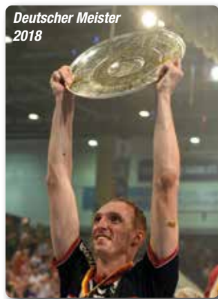
Deutscher Meister 2018