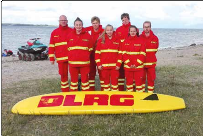
Eine Wach-Crew aus Jarplund und Weding in Westerholz.

Spenden immer gerne gesehen. Ein besonderes Dankeschön geht an die Nospa, die bei der Anschaffung einer Übungspuppe half.