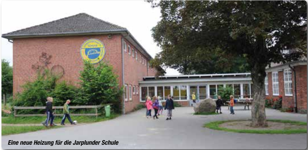
Eine neue Heizung für die Jarplunder Schule