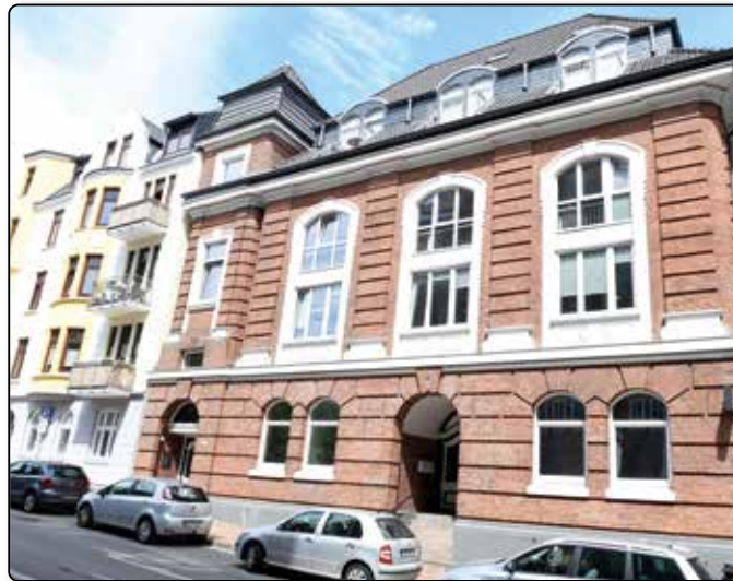
Nordergraben 70: Das einstige „Hotel am Stadtpark“