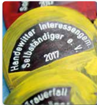
Die Schuppe der H.I.S. von 2017

drei Jahre. „Es handelt sich um die Einnahmen und nicht den