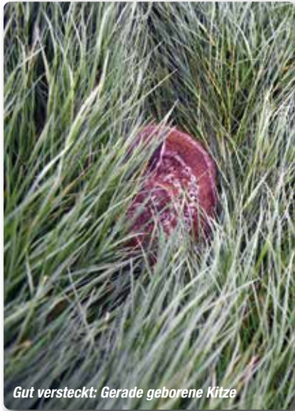
Gut versteckt: Gerade geborene Kitz

ist. Die Landwirte, die kooperieren, informieren die „Wildtierrettung Handewitt“ am Abend vor dem Dreschvorgang. Der Wunsch: Die Zeit zwischen Suche und Heuernte soll möglichst weit reduziert werden, damit keine neuen Rehe auf das Areal gelangen.