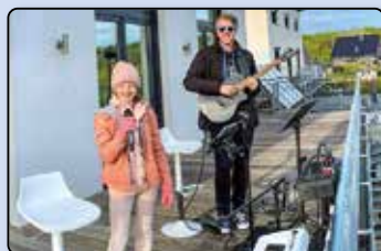
Für die Nachbarschaft: Musik verbindet – trotz Corona Seite 53