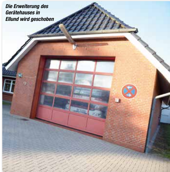
Die Erweiterung des Gerätehauses in Ellund wird geschoben