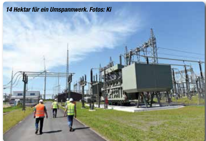
14 Hektar für ein Umspannwerk.

fertiggestellt“, meint Umspannwerk-Projektleiter Matthias Schube. Am 21. Oktober soll es eine deutsch-dänische Einweihungsfeier für den letzten Abschnitt der Stromautobahn geben. (ki) ■