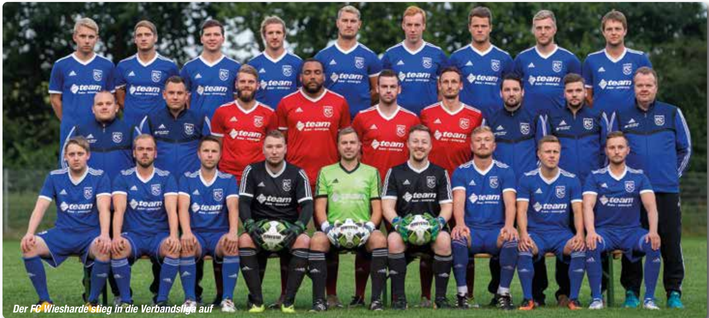
Der FC Wiesharde stieg in die Verbandsliga auf

Als im März die Saison in der Kreisliga unterbrochen wurde, regierte die Ungewissheit. Der FC Wiesharde war Tabellenführer, hatte aber noch mehrere Spiele auszutragen. Am grünen Verbandstisch wurde dann entschieden: Die Geest-Kicker dürfen in die Verbandsliga aufsteigen, obwohl die Spielzeit vorzeitig beendet wurde. Die Redaktion sprach mit dem FC-Trainer.