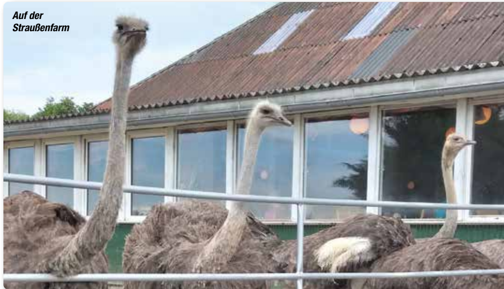
Auf der Straußenfarm

Nach einer langen Corona-Pause startete der Sozialverband