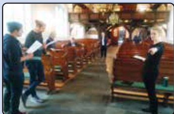
Zurück zu Normal und Konfirmationen 2020 ab Seite 33