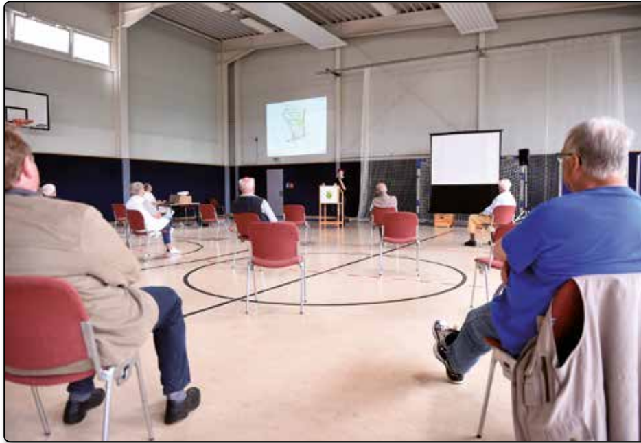
Bürger-Info in der „Wikinghalle II“.