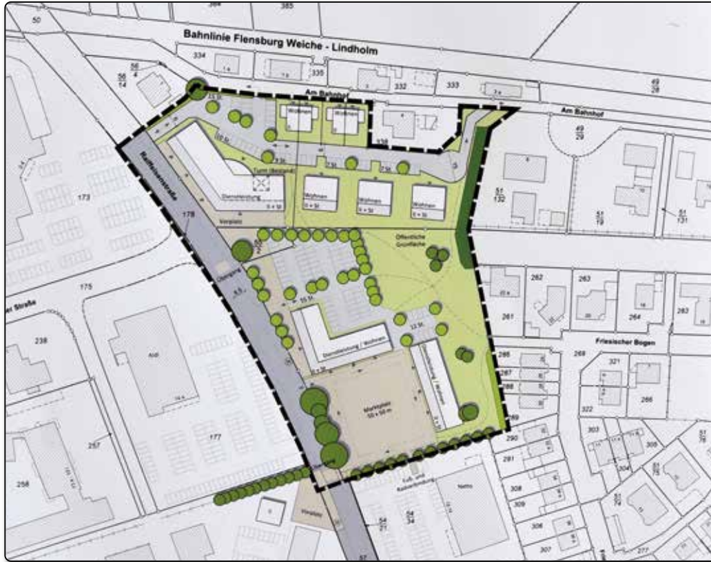
Der Entwurf für den B-Plan Nummer 38.