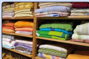
Neues aus der Kleiderstube Seite 48