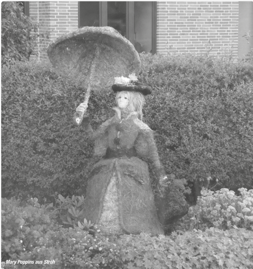
Mary Poppins aus Stroh