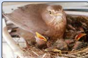
Von Vögeln und Ausgeflogenen in der Waldkita ab Seite 44