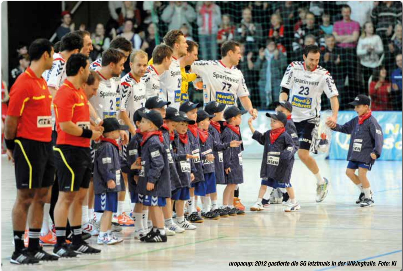
uropacup: 2012 gastierte die SG letztmals in der Wikinghalle.

Es war „Matchball“ und Abschied zugleich. Am 9. April 1995, also vor 25 Jahren, bestritt die SG Flensburg-Handewitt letztmals eine Bundesliga-Partie in der Handewitter Wikinghalle – und hatte es mit einem Sieg über Bayer Dormagen selbst in der Hand, erstmals in einen Europapokal-Wettbewerb vorzustoßen. Das