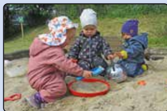
Neuer Spielplatz im ADS- Sportkindergarten ab Seite 42