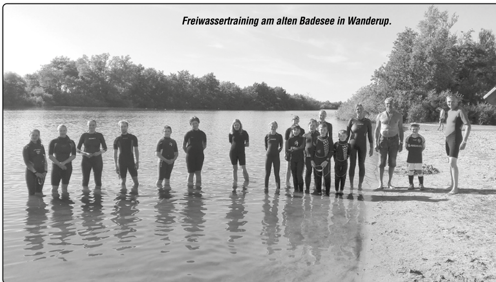
Freiwassertraining am alten Badesees in Wanderup.

Keine zwei Wochen später reifte mit Aufkommen des sonnigen Wetters die nächste Idee. Wenn auch das Schwimmen in der Schwimmhalle noch nicht möglich war: Outdoor-Sportarten waren unter Auflagen wieder erlaubt. Nach einer schwimmerischen Erkundung des Badesees Wanderup wurden drei Übungsgruppen für ein Freiwassertraining geschaffen. Dieses wurde mit durchschnittlich zehn bis 16 Teilnehmern sehr gut angenommen. Da das Training komplett im offenen und tiefen Wasser stattfand, war die Mindestvoraussetzung zur Teilnahme am Outdoor-Training das deutsche Schwimmabzeichen „Gold“. Auch das Tragen eines Neoprenanzugs war Bedingung. Aufgrund der anhaltenden Nachfrage wird das