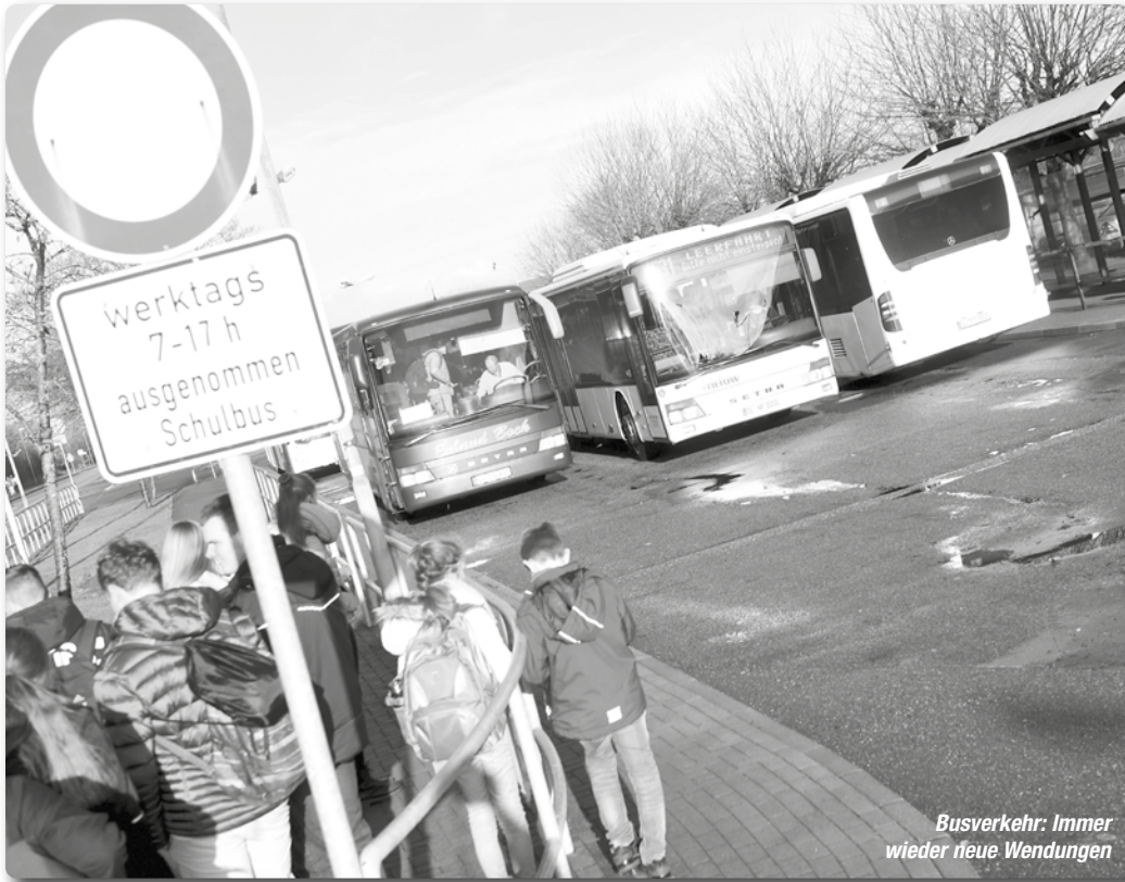
Busverkehr: Immer wieder neue Wendungen

Eine erneute Wende: Das Verwaltungsgericht Schleswig hat im einstweiligen Rechtschutzverfahren entschieden, dass der Kreis Schleswig-