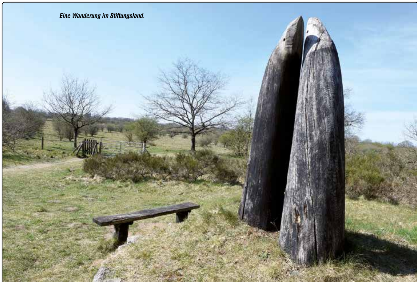
Eine Wanderung im Stiftungsland.

Gerd Kämmer, langjähriger Geschäftsführer von „Bunde Wischen“, wird am Donnerstag, 13. August, eine „Walk & Talk“-Tour durch den Nordteil des Stiftungsland Schäferhaus führen. Die Teilnehmer werden durch das Stiftungsland wandern (etwa fünf Kilometer) und dabei ins Ge-