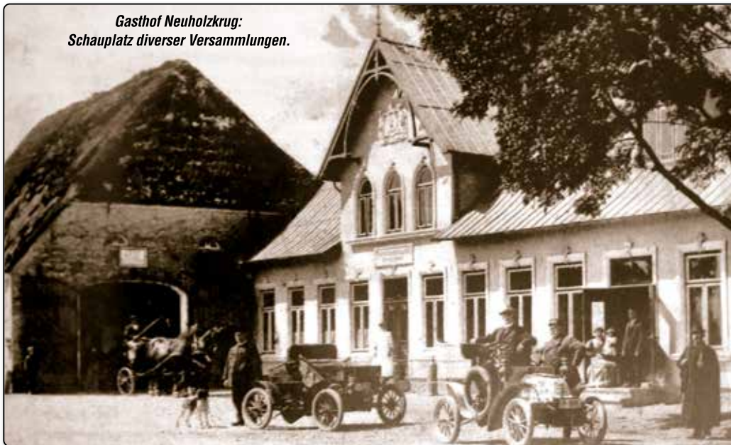
Gasthof Neuholzkrug: Schauplatz diverser Versammlungen.

Ein Konvoi mit zehn Pferdefuhrwerken war unterwegs. Am 14. März 1920 sollte eine Volksabstimmung den neuen Grenzverlauf zwischen Deutschland und Dänemark festlegen. In der zweiten Zone waren alle Bürger wahlberechtigt, die dort geboren waren. Deshalb nahmen tags zuvor mehrere Sonderzüge aus unterschiedlichen Teilen Deutschlands Kurs auf Flensburg. Und die Hauruper holten ihre Abstimmungsgäste in der Fördestadt ab.