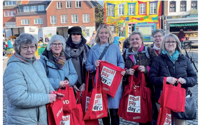
Gleichstellungsbeauftragte und Akteurinnen des SoVD informieren auf dem Bredstedter Marktplatz zum „Equal Pay Day“.

Unter dem Motto „Weil es sich lohnt - Entgelttransparenz jetzt!“ rückt die diesjährige EPD-Kampagne den Zusammenhang von Lohntransparenz und Gehaltsunterschied zwischen Frauen und Männern in den Fokus. Denn wegen mangelnder Transparenz blieben Lohnunterschiede und Entgeltdiskriminierung oft unbemerkt, heißt es vom EPD. Inwiefern hängen Stereotype, Diskriminierung und fehlende Entgelttransparenz