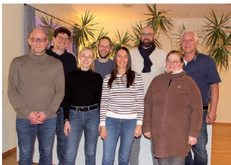
Der aktuelle Vorstand des HGV Bredstedt.

Unter reger Beteiligung der Vereinsmitglieder fand die jüngste Jahreshauptversammlung des HGV Bredstedt statt. Im Struckumer Landgasthof blickte der Vorstand zurück auf ein ereignisreiches Jahr und verschaffte den Teilnehmenden zugleich eine Vorausschau auf die Ereignisse in